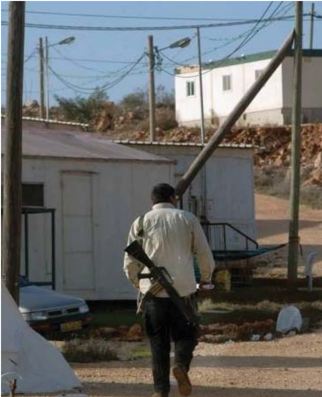
מאחז בדרום הגדה המערבית

מאז תחילת שנות השמונים, מהווה תופעת האלימות מצד מתנחלים ישראלים גורם מרכזי המערער את ביטחונם האישי ופוגע בפרנסתם של פלסטינים באזורים רבים של הגדה המערבית 1 . במסגרת תופעה מתמשכת זו הופיע בשנת 2008 דפוס חדש של אלימות, המכונה בפי המתנחלים מדיניות "תג המחיר", שבמסגרתה המתנחלים ייגבו "מחיר" כנגד פלסטינים ורכושם בתגובה לניסיונות מצד רשויות ישראל לפרק מאחזים "בלתי מורשים" 2 . דפוס אלימות חדש זה מעלה חששות נוספים בנוגע להגנה על אזרחים פלסטינים. דוח זה מהווה ניסיון ראשון לשרטט את קווי המתאר של חששות אלו ולהציע גישה מונעת, הכוללת מיפוי של הקהילות הפלסטיניות הפגיעות לאלימות מצד מתנחלים.