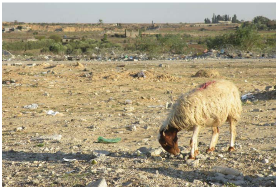
אחרי ינואר 2009, ההערכה היא כי 46% מהאדמות החקלאיות בעזה אינן נגישות או שלא ניתן לעבדן.

למעלה מ-1000 ימים של מצור כמעט מוחלט עשו שמות במקורות המחייה ובשגרת חייהם של תושבי רצועת עזה. עם זאת, בעזרת השקעה של תשומות פשוטות והגדלת הגישה לאדמה, יש למגזר החקלאי יכולת פוטנציאלית לחולל שיפור משמעותי באיכות החיים, המזון והביטחון התזונתי של כ-1.5 מיליוני פלסטינים.