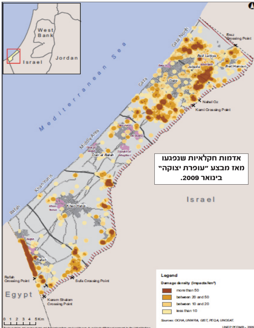
אדמות חקלאיות שנפגעו מאז מבצע "עופרת יצוקה" בינואר 2009.

ארגון המזון והחקלאות של האו"ם (FAO) אתר: www.fao.org משרד בגדה המערבית וברצועת עזה: רחוב הר הזיתים 25, שכונת שיחי ג'יראח, ת.ד. 22246 טלפון: +972 (0)2 532 1950 פקס: +972 (0)2 540 0027