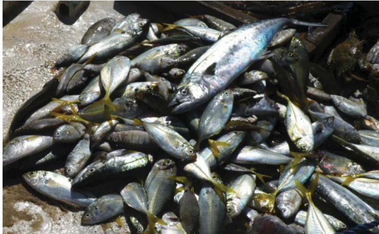
שטחי הדיג של עזה צומצמו לכדי שלושה מיילים ימיים

המחסור במשאבי המים ברצועת עזה הינו קריטי, ולאור העובדה שהמגזר החקלאי מייצג מעל ל-60% מהביקוש למים, 30 חיוני להביא לשיפור מידי הן בכמות המים והן באיכותם. חקלאים נאלצים להשתמש במים מלוחים ומזהמים מבארות חקלאיות להשקיה, תופעה מסכנת את בריאות האוכלוסייה בשל הפגיעה באיכות המזון הנובעת מכך. העלייה בביקוש למים לחקלאות אילצה חקלאים לחפור יותר מ-2,000 בארות בלא היתר, 31 המטילות מעמסה מופרזת על אקוויפר החוף ומגבירות את המלחת מי התהום, ולפיכך מגבילות את הייצור החקלאי. דרושה בנייה נרחבת של תשתית מים לשימוש ביתי וחקלאי כאחד. רשת המים לקויה וכרגע, רק 57% מן המים המוזרמים אל הרשת מנוצלים, 32 בעיקר בעטיין של דליפות המצריכות שיקום נרחב ויסודי של רשת המים.